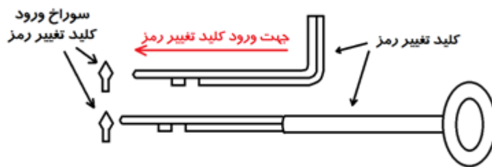
شکل ۲: شکل ورود قرار گرفتن کلید تغییر رمز

۲- کلید تغییر رمز را از پشت درب وارد نموده و ۹۰ درجه در جهت خلاف چرخش عقربه های ساعت بچرخانید. در این حالت رمز قبلی پاک شده و قفل رمز آماده پذیرش رمز جدید می باشد. مانند شکل زیر: