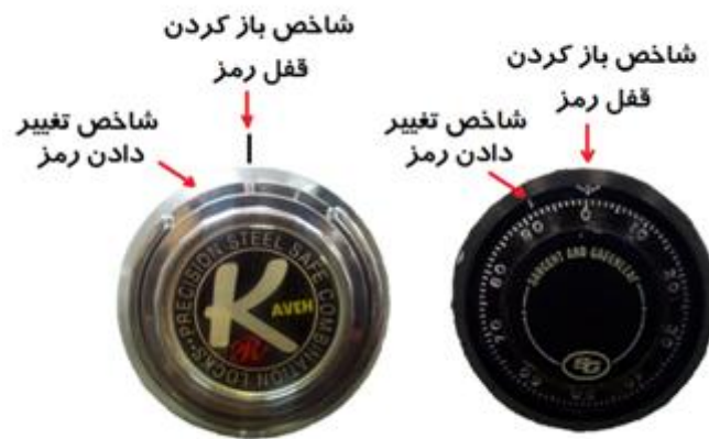
شکل ۱: شاخصهای موجود در قفلهای رمز

انواع رمزهای مکانیکی مورد استفاده در صندوقهای کاوه دارای دو دسته بندی زیر میباشند: