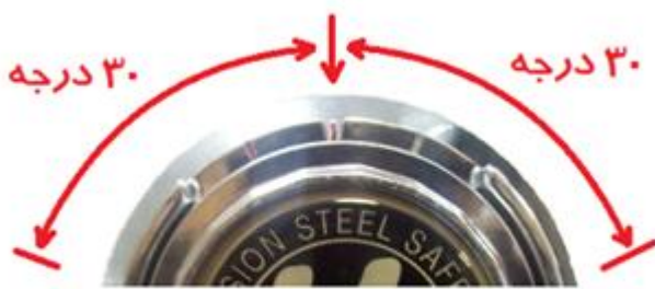
شکل ۳: فاصله بین اعداد انتخابی برای رمز

توجه ۲: فاصله اعداد انتخابی بین مراحل یک و دو همچنین بین مراحل دو و سه بیشتر از ۳۰ درجه در هر دو جهت باشد.